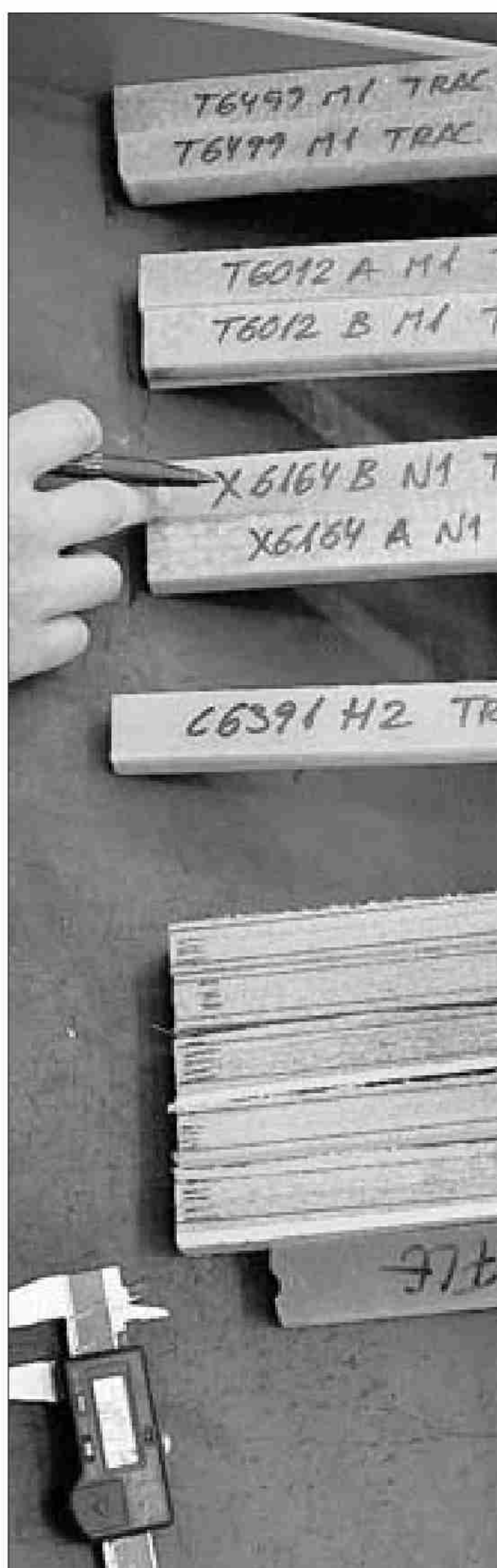
Trabajos de etiquetado.

«La Red Exterior de Colaboradores», que durante este último año ha incorporado especialistas sectoriales en mercados tradicionales y también en nuevos mercados,